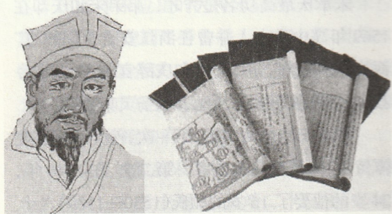
▲ 宋应星(左);《天工开物》书影(右)

有道是：“盖文章，经国之大业，不朽之盛事。”(曹丕《典论·论文》)宋应星是明末著名的科学家、思想家，其包含了农业和手工业生产知识的《天工开物》一书诞生之后，流入东亚、欧美，得到学者们极大的推崇，形成了广泛的国际影响力，此书演绎出了著名的天工文化。本文着笔于宋应星的先辈、同辈，介绍他们的故事。